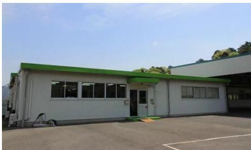
▲長門市 6 次産業化支援施設「ながとラボ」

また、「よそ者」人材による新しい視点は、地元産品の魅力を再発見し、地域の活性化につながる大きな可能性があります。外部からの視点を取り入れることで、これまで気づかなかった地域資源の価値を引き出し、付加価値を創造していくことで生産者等の所得が向上されることも期待しています。