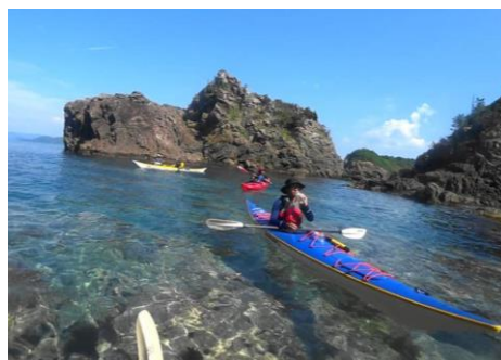
最高の海へ漕ぎ出そう！