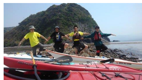
ゆやアウトドアクラブメンバー