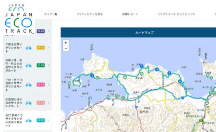
ジャパンエコトラック認定エリアに