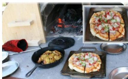
キャンプ場にはピザ窯もあります