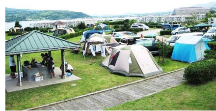
伊上海浜公園オートキャンプ場